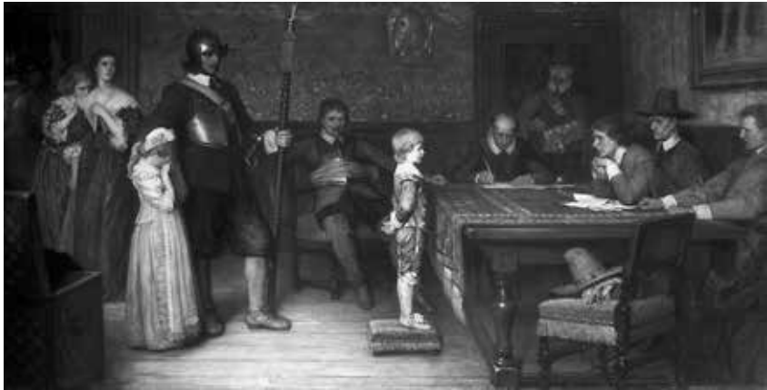
Рисунок 1. William Frederick Yeames, «And when did you last see your father?», 1878

ходилось бороться за право выставить свои работы в Королевской академии. Тем не менее с 1866 г. Уильям Фредерик Емес становится членом Королевской академии художеств. Емес нередко любил проводить каникулы в замке Хивер, бывшей резиденции Анны Болейн – второй жены Генриха VIII и матери королевы Елизаветы. Замок-образец Тюдоровской архитектуры зачастую становился местом действия многих его полотен. Это историческое окружение благотворно влияло на его творчество, придавая его полотнам антураж и пушью достоверность, которых так не хватало живописи предыдущего столетия.