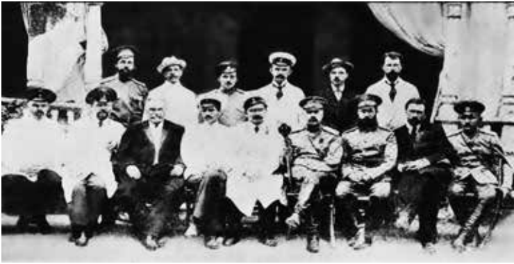
Президиум 1-го Войскового Круга. Новочеркасск. 18 июня 1917 года

ства. Но его конфронтация с атаманской властью, делает его бессильным перед наступлением большевиков, которые стремятся создать Донскую Социалистическую Республику.