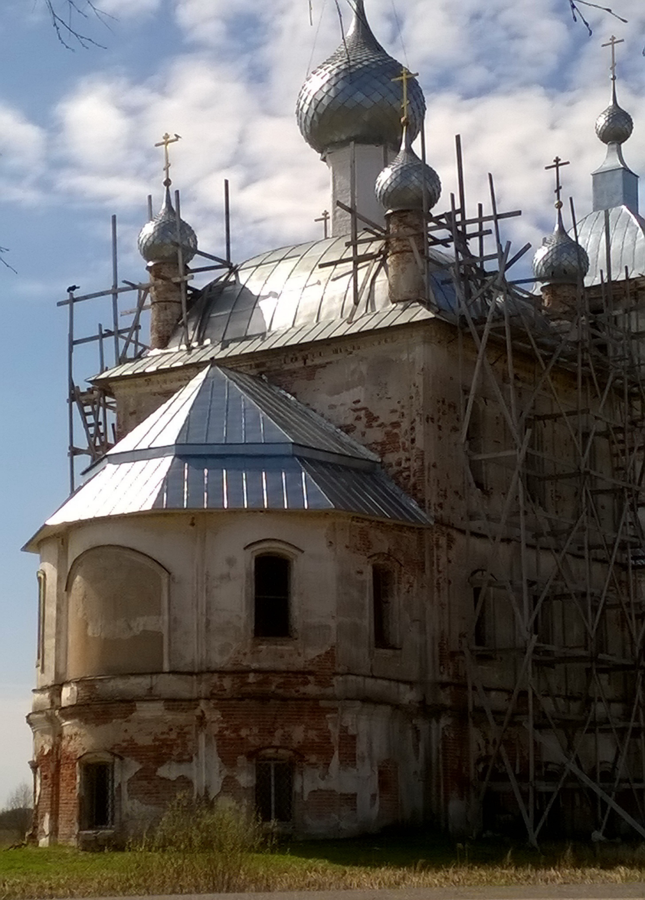
церковь с. Архангельского Мышкинского района